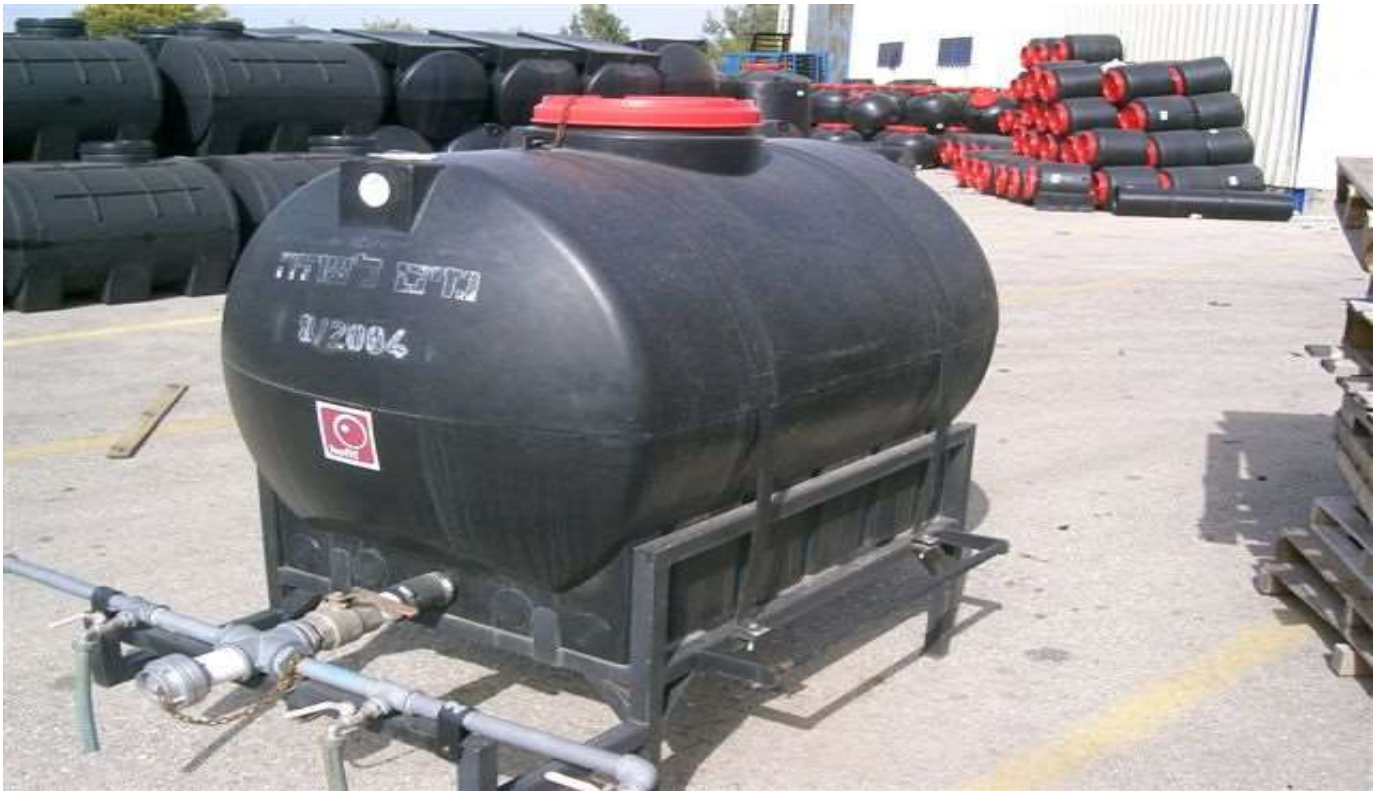
מיכל 1 קוב מסוג 'קומבו' (1,000 ליטר) עם ברזיות לחלוקת מים בתחנת חלוקה.